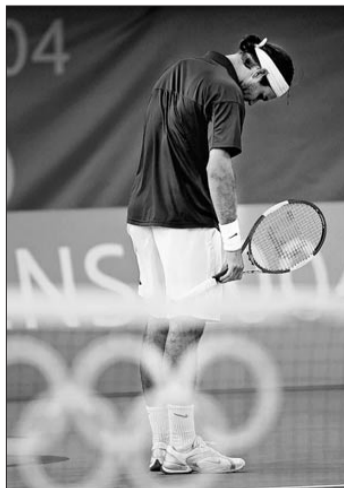
Bereits in der zweiten Runde scheidet Goldhoffnung Roger Federer aus. Bezwungen wird er mit 4:6, 7:5 und 7:5 vom jungen Tschechen Tomas Berdych.